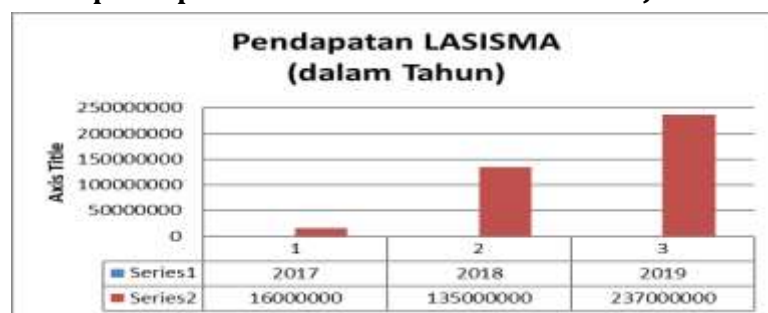
Tabel 10 Pendapatan produk LASISMA dari tahun 2017- Juli 2019

Adapun pendapatan BMT dari produk LASISMA mengalami peningkatan dari tahun ke tahun sebagai berikut: