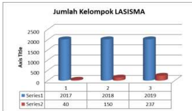
Tabel 13 Jumlah Kelompok LASISMA di BMT NU Cabang Ganding.

Adapun perkembangan anggota LASISMA adalah sebagai berikut: